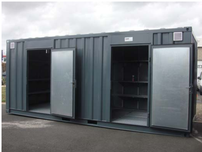
Cloisonnement intérieur grillagé, 2 portes d'accès piéton, isolation et chauffage