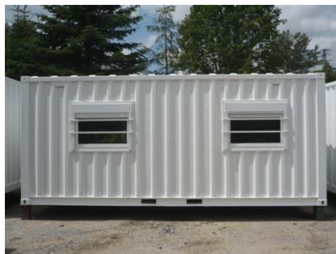
Fenêtre avec barreaux de protection