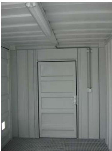
Vue intérieure Portillon de service