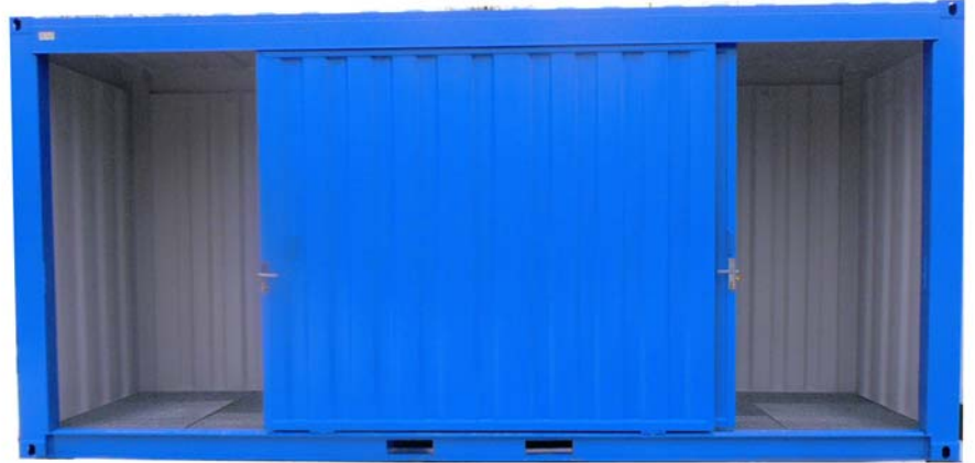
CSR61L avec portes coulissantes