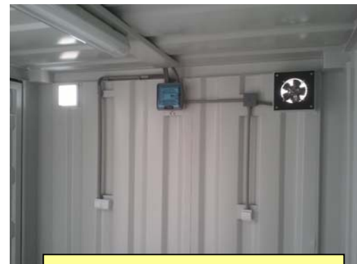
Ventilation mécanique standard + prise de courant 220 V