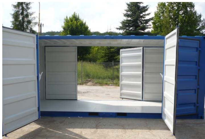
Conteneur CSR61L avec portes 4 battants sur les 2 grands côtés, ouverture totale possible sur les 2 côtés