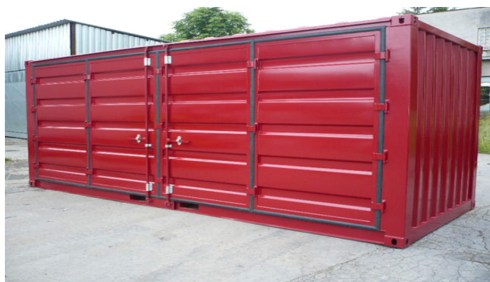
▲ CSR61L avec porte 4 battants sur grand côté ►