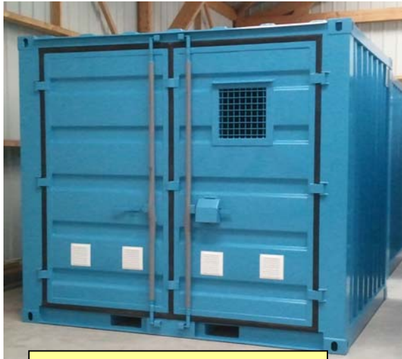
CSR31L avec ouverture grillagée sur porte