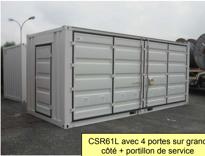
CSR61L avec 4 portes sur grand côté + portillon de service