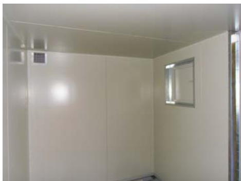
Isolation en panneaux coupe-feu / trappe désenfumage en facade